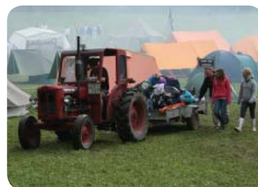
Mora scoutkår flyttar från sin översvämmade by till en ny